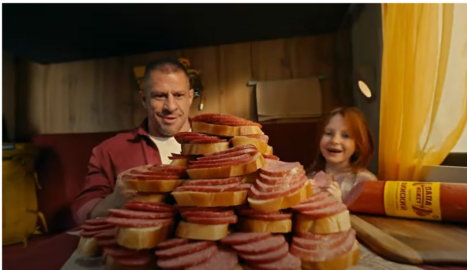
Колбаса «Папа может»